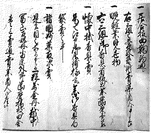
(生実町鏞木家文書)

按摩(もみ療治)や口中治療をする辻医師や、ミカンや梨の砂糖漬け売り、櫛・笄・紅白粉など小間物売り、火打ち・よもぎ火口売りなどが香具師で、その理由が書かれています。