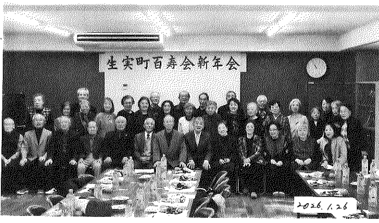
生実町百寿会新年会